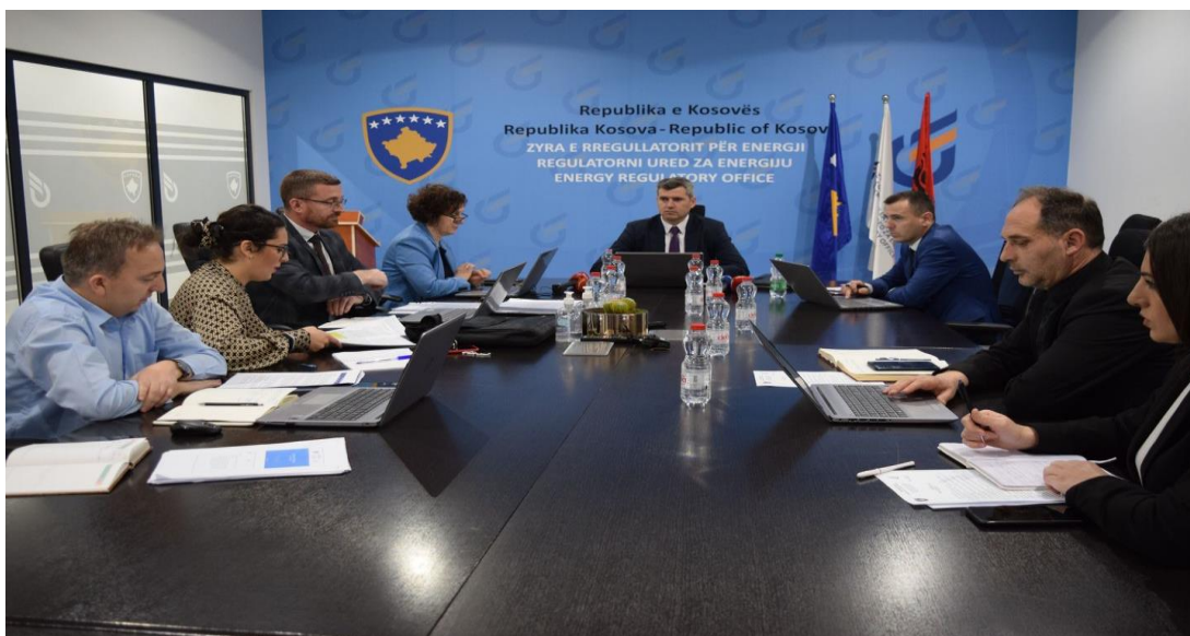
23 Mars 2023, Seanca e dytë e Bordit të Rregullatorit

Në këtë seancë janë shqyrtuar dhe miratuar Planet Zhvillimore dhjetë (10) vjeçare dhe Planet Zhvillimore Investive pesë (5) vjeçare për Operatorin e Sistemit të Transmetimit dhe Operatorin e Sistemit të Shpërndarjes, bilancet e energjisë termike si dhe janë shqyrtuar dhe aprovuar tetëmbëdhjetë (18) kërkesa të konsumatorëve për autorizim për vetë-konsum, nga të cilat njëmbëdhjetë (11) vijnë nga ndërmarrjet dhe shtatë (7) nga personat fizik me gjithsej 605kW.