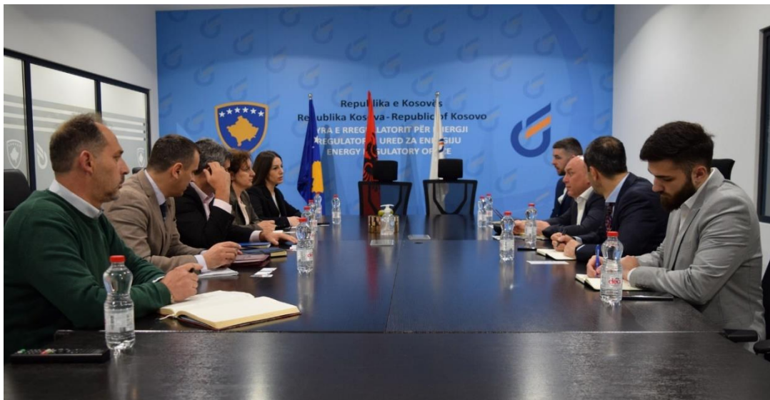
Gjatë takimit mes Bordit të Zyrës së Rregullatorit për Energji dhe përfaqësuesve të kompanisë amerikane EnerSys

Në këtë takim u diskutua rreth diversifikimit të gjenerimit të burimeve të ripërtërithme të energjisë dhe perspektivës së tranzicionit dhe qëndrueshmërisë në sektorin e energjisë, të nxitura nga iniciativat e shumta ndërkombëtare.