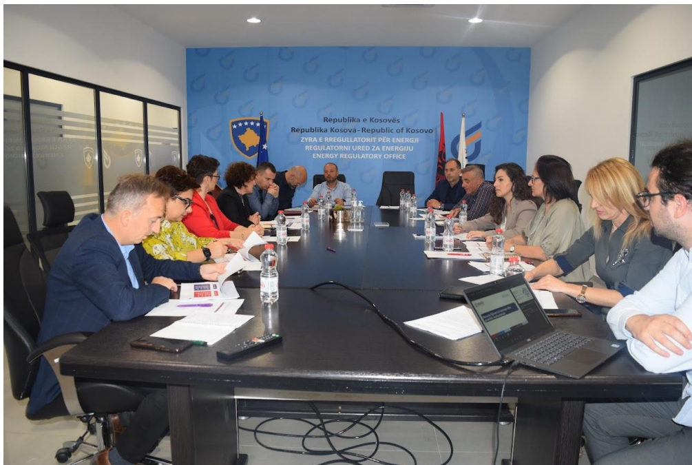
13 qershor 2023, Pjesëmarrësit nga ZRRE, Tetra Tech dhe USAID për barazi gjinore

Ky trajnim është fokusuar në avancimin dhe njoftimin e mëtejshëm të stafit të ZRRE-së lidhur me çështjet e barazisë gjinore, diversitetit dhe përfshirjen në ndryshimet e synuara në lidhje me barazinë gjinore që është vazhdimësi e një serë trajnimesh të organizuara nga NARUC dhe USAID lidhur me këtë temë, ku kanë qenë pjesëmarrës edhe anëtarë të stafit të ZRRE-së. Në kuadër të këtij trajnimi, po ashtu u prezantua edhe rrugëtimi i ZRRE-së drejt barazisë gjinore si dhe plani i veprimit për arritjen e këtij qëllimi.