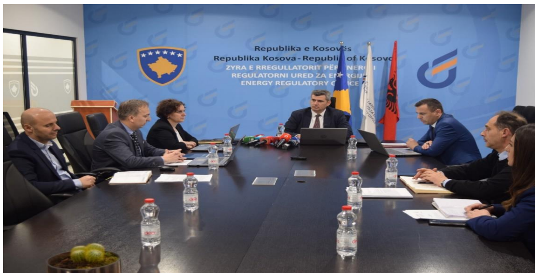
30 Mars 2023, Seanca e tretë e Bordit të Rregullatorit

ZRRE-ja njofton të gjithë konsumatorët se çmimet e reja të energjisë do të aplikohen për sasinë e energjisë të konsumuar nga data 1 Prill 2023 .