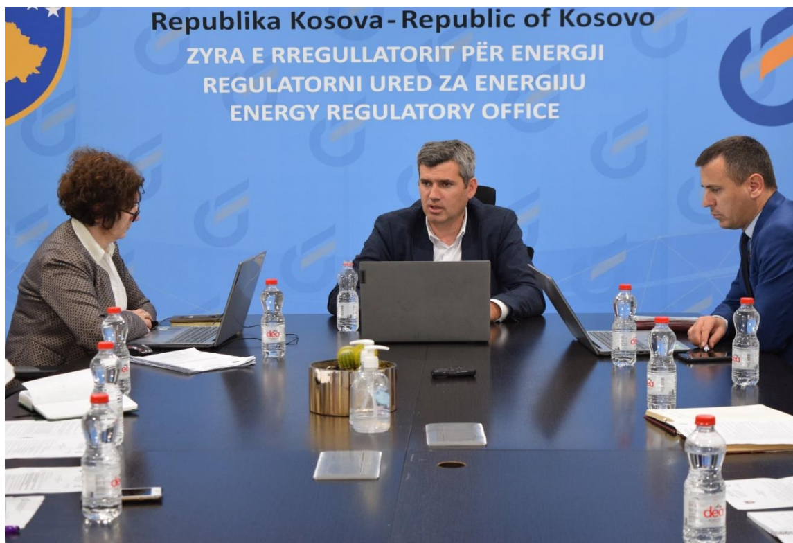
30 Mars 2023, Seanca e katërt e Bordit të Rregullatorit

Në këtë seancë, pas shqyrtimit përfundimtar të raporteve të monitorimit për shkak të shkeljeve ligjore të konstatuara për blerjet e energjisë elektrike, pagesat dhe nominimet, Bordi ka vendosur gjobë ne vlerën prej 3.2 milion euro për Korporatën Energjetike të Kosovës dhe 439.000 euro për Operatorin e Sistemit të Transmetimit dhe Tregut (KOSTT).