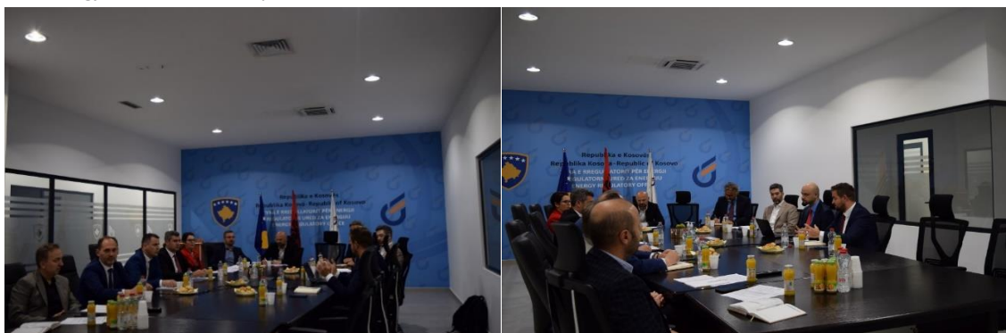
Gjatë takimit me përfaqësues të NARUC lidhur me bashkimin e tregjeve të energjisë

Këshilltarët teknik të NARUC-it janë duke mbështetur rregullatorët e Shqipërisë, Kosovës dhe Maqedonisë së Veriut për bashkimin e tregjeve të këtyre tri vendeve që kanë për synim rritjen e efikasitetit të përgjithshëm të tregtimit duke nxitur konkurrencën efektive, rritur likuiditetin dhe duke mundësuar përdorimin më efikas të burimeve të gjenerimit dhe kapacitetit ndërkufitar.