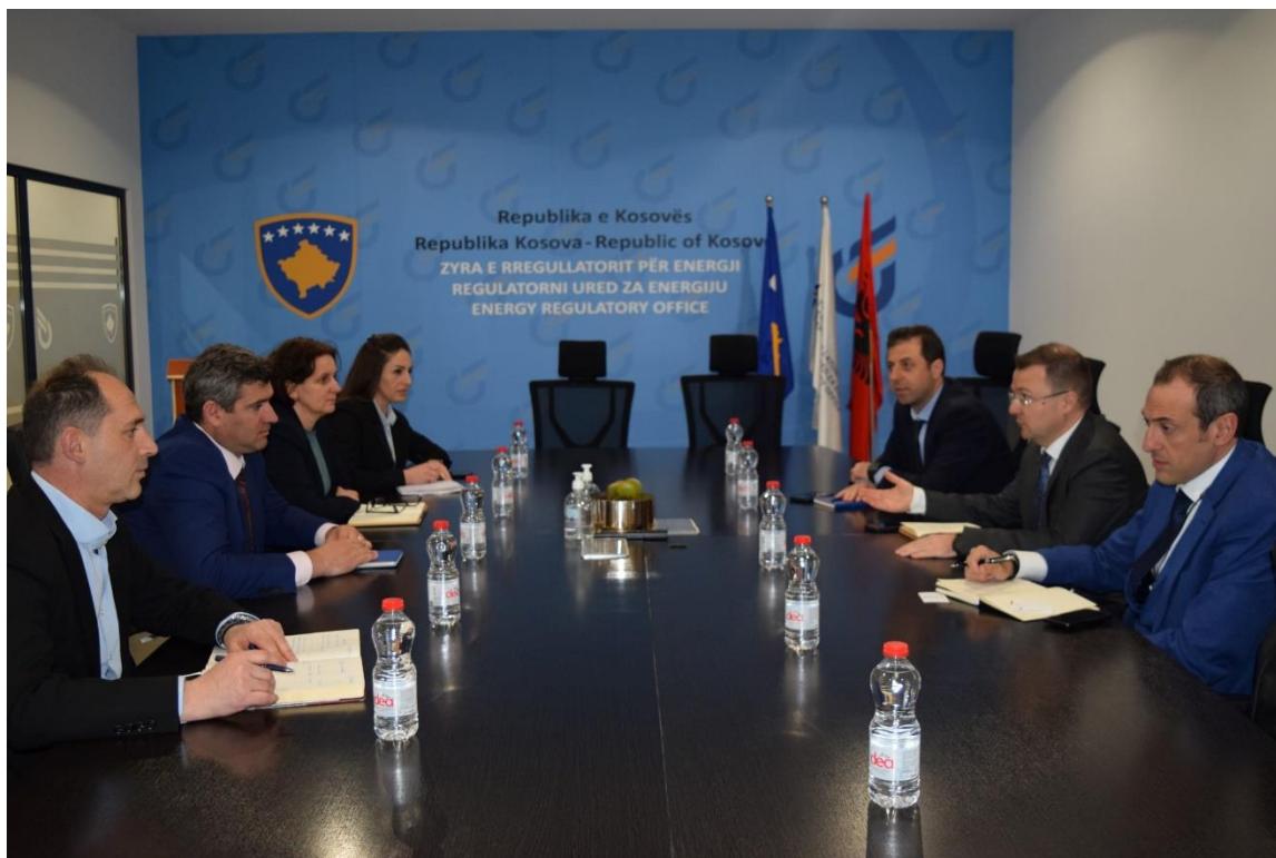
20 Mars 2023, Takimi i Bordit të Rregullatorit me përfaqësues të EBRD-së

Duke vlerësuar lartë bashkëpunimin ndër vite, u theksua përkushtimi i përbashkët për zhvillimin dhe fuqizimin e mëtutjeshëm të partneritetit me EBRD në procese të rëndësishme për zhvillimin e sektorit, me theks të veçantë në projektet e infrastrukturës së KOSTT dhe KEDS që kanë të bëjnë me integrimin e BRE-ve