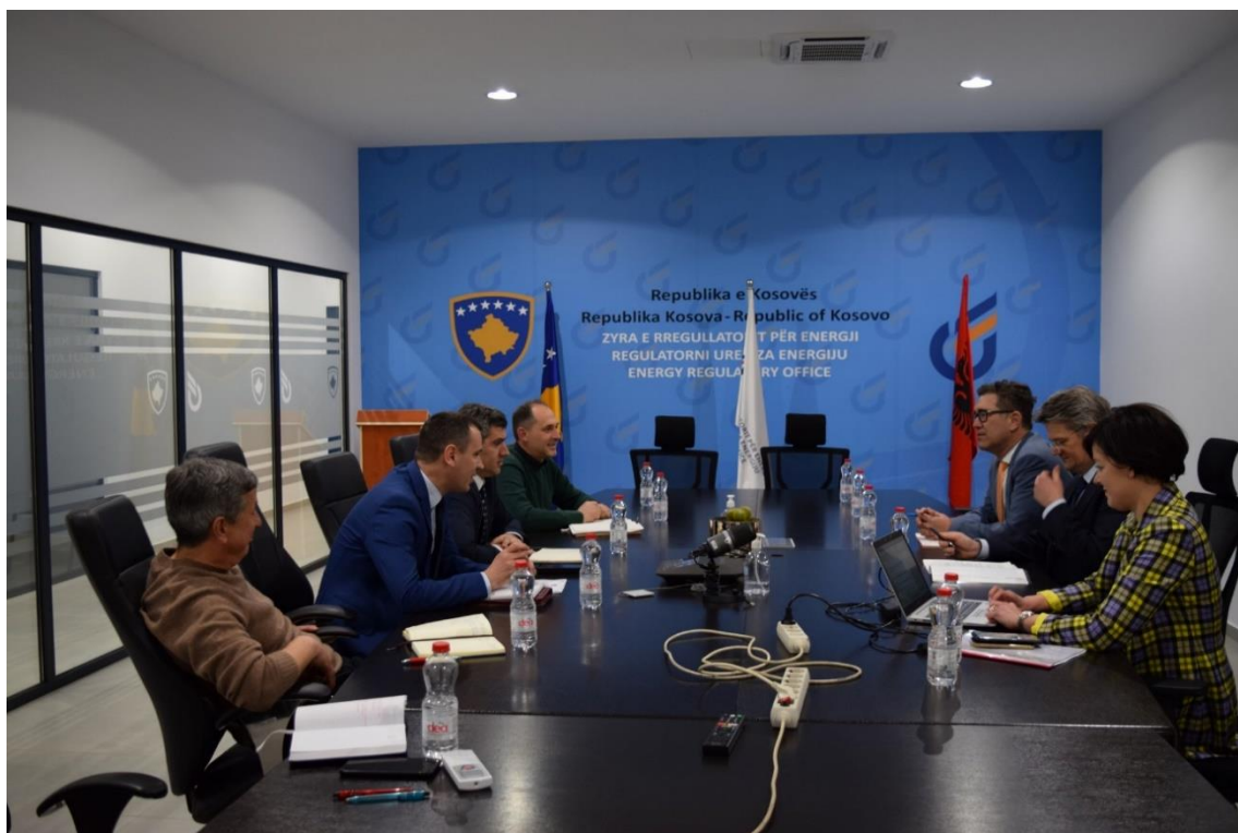
Mars 2023, Gjatë takimit me përfaqësues të SKE-së