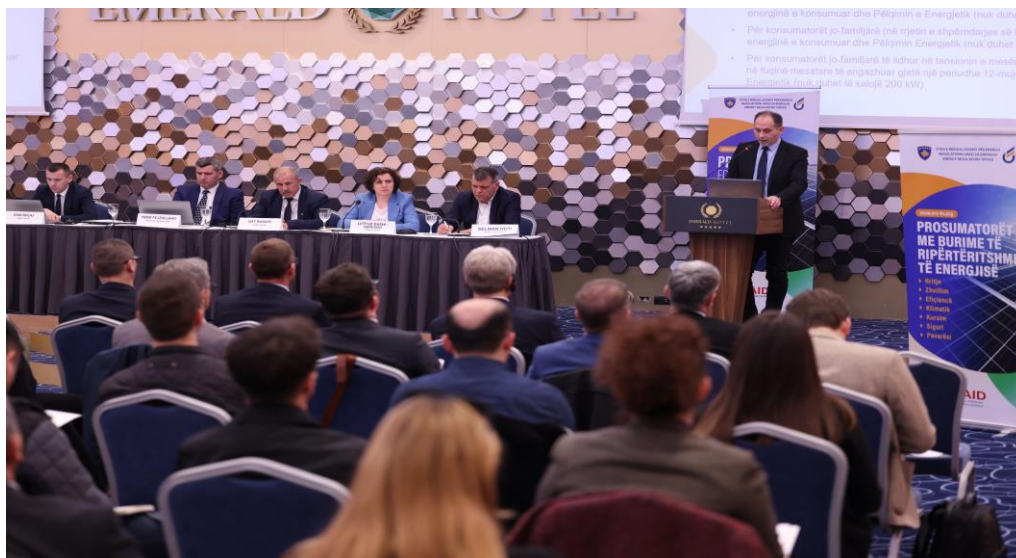
Prezantimi i Draft- Rregullës për Prosumatorët

Konsumatorët tani do të kenë një bazë ligjore të përcaktuar për të gjeneruar energjinë e tyre dhe mund të përfitojnë si nga kursimet e kostos nga vetë-prodhimi ashtu edhe nga injektimi në rrjet i energjisë së tepërt të prodhuar por që nuk përdoret nga ta.