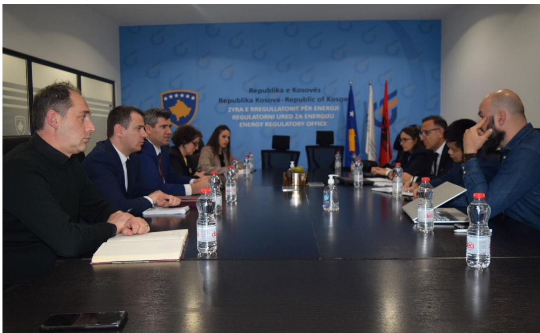
Mars 2023, Takimi i Bordit të Rregullatorit me përfaqësues të FMN-së

Në vazhdim, përfaqësuesit e ZRRE-së dhanë shpjegime të hollësishme, deri në detaje, mbi metodologjinë dhe të dhënat e përdorura për vlerësimin e të Hyrave të Lejuara Maksimale për vitin 2023.