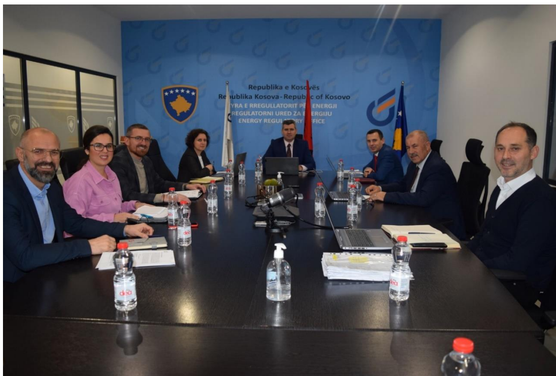
Seanca e parë e Bordit të ZRRE-së

Në seancën e parë të vitit 2023, e cila është mbajtur më 27.01.2023, Bordi i Zyrës së Rregullatorit për Energji (ZRRE) ka miratuar Bilancin Vjetor të Energjisë Elektrike për 2023. Qëllimi kryesor i miratimit të Bilancit Vjetor të Energjisë Elektrike është që të projektojë përmbushjen e nevojave të konsumatorëve me energji elektrike, në sasi të mjaftueshme gjatë vitit, duke angazhuar kapacitetet e prodhimit dhe importit të energjisë elektrike.