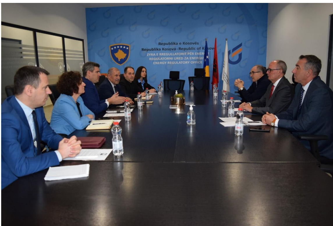
Mars 2023, Takimi i Bordit të Rregullatorit me Bordin e Asociacionit të Komunave

Ky takim kishte për qëllim informimin e Asociacionit të Komunave me situatën në sektorin e energjisë elektrike me fokus të veçantë në planet zhvillimore të Operatorit të Sistemit të Shpërndarjes (KEDS) dhe gjetjen e mundësive të reja të bashkëpunimit midis Rregullatorit dhe Asociacionit të Komunave të Kosovës, duke pasur si prioritet sigurinë e furnizimit me energji elektrike të konsumatorëve dhe përmirësimin e standardeve të shërbimit për konsumatorë përmes shtimit të investimeve në rrjetin e shpërndarjes.