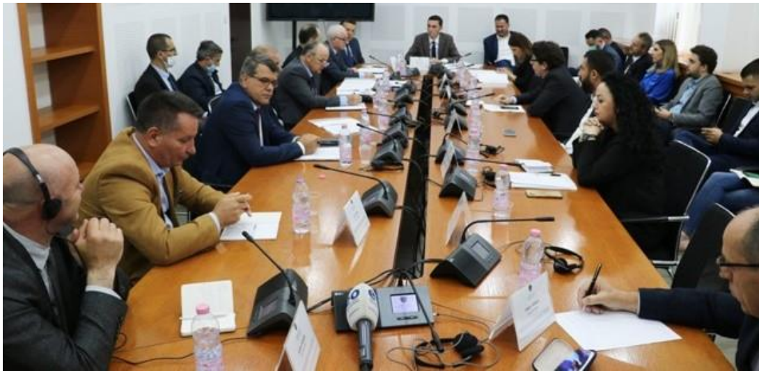
Raportimi i Bordit dhe menaxhmentit të ZRRE para Komisionit Parlamentar

Të gjitha raportet vjetore të ZRRE janë të publikuara në vegzën: https://www.ero-ks.org/zrre/sq/publikimet/raportet-vjetore .