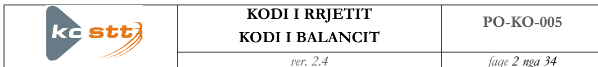
TABELA E PËRMBAJTJES